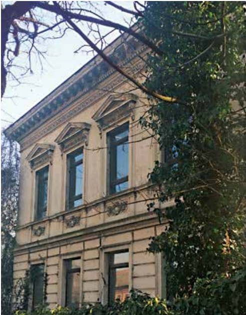
Das historische Fabrikantenhaus wird revitalisiert

Bäder mit Markenausstattung, Parkettböden nach Wunsch, Terrassen und Balkone aus feinstem Steinbelag und ein modernes Energiemanagement nach der Energiesparverordnung von 2014 machen die Eigentumswohnungen und Einfamilienhäuser an der Walder Straße zu Objekten der Begierde.