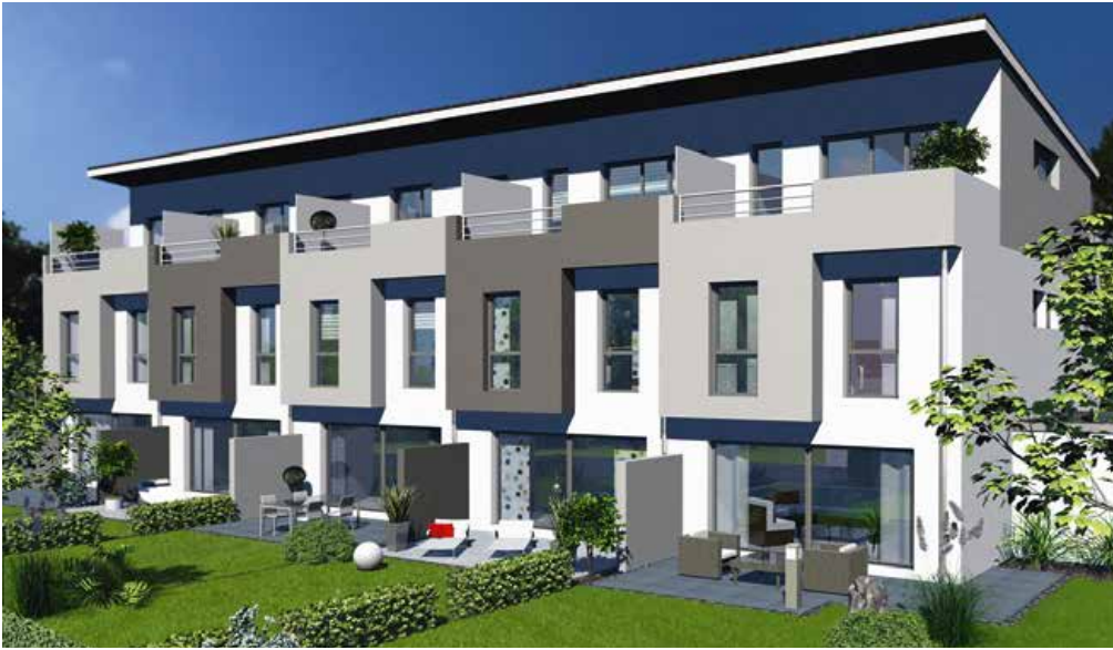
Gartenansicht der Einfamilienhäuser