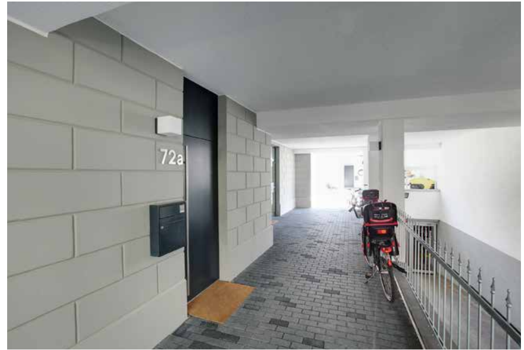
Überdachter Eingangsbereich und Durchgang zum Garten

In Bilk, in einem der beliebtesten Stadtteile Düsseldorfs, sind auf der Florastraße in knapp zwei Jahren zehn Eigentumswohnungen »de luxe«, ein großzügiges Penthouse mit Blick über die Stadt und drei elegante Stadtvillen im Garten entstanden. Die Fassade des komfortablen Vorderhauses ist im Stil der Jahrhundertwende neu entworfen und in zukunftsweisender Technik errichtet worden. Die zweigeschossigen Stadtvillen kommen mit Garten, Atrium oder Dachterrassen ebenfalls einer modernen, urbanen Lebensweise entgegen. Die neuen Bewohner konnten den sonnenreichen Sommer schon in ihrem neuen Domizil genießen.