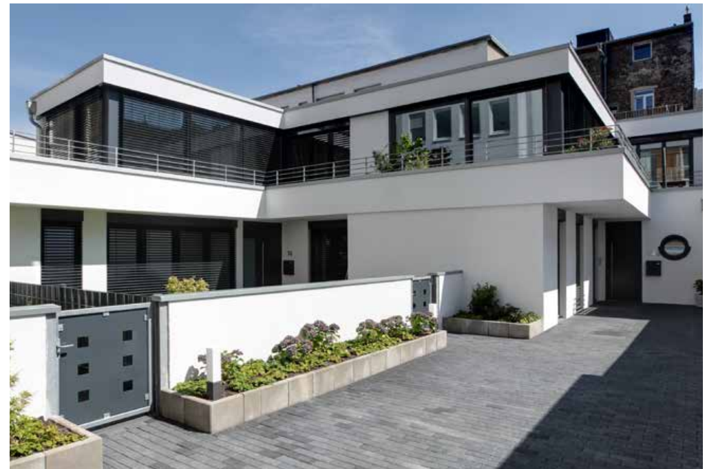
Die Stadtvillen öffnen sich zur Südwestseite

Renditehäuser in DU, KR, MG: Anfangsrendite 7,0-8,5 Prozent