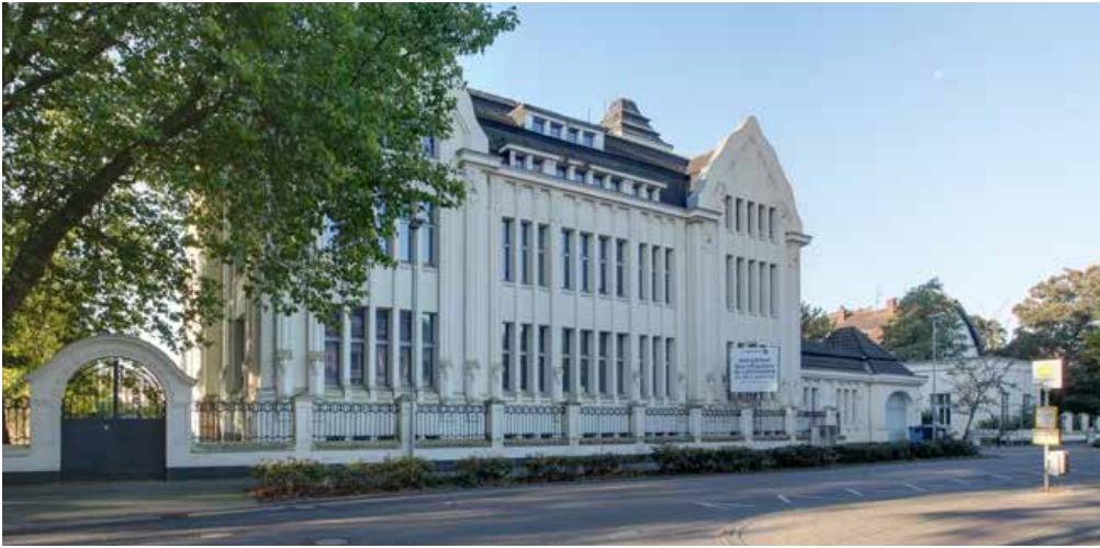
Hier wurde 1914 die sogenannte Becker-Kanone entwickelt